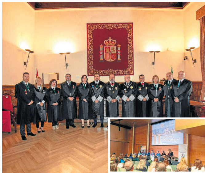
Actos Institucionales 2022.

En cuanto a las competencias "de gestión", los Graduados Sociales, se encargan y desa-