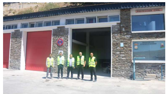
El diputado de Asistencia a Municipios visita las obras del parque de Sierra Nevada.