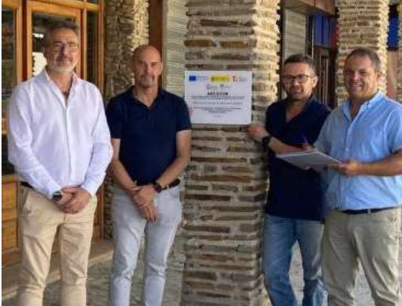
La actuación ha sido posible gracias a la intervención del proyecto Arcotur, gestionado por la Diputación de Granada.