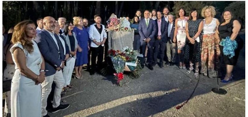
Ofrenda floral a las víctimas de la Guerra Civil.

El acto, que se desarrolló en el parque del municipio de Alfacar que lleva el nombre del poeta, comenzó con la tradicional ofrenda floral ante el monolito a las víctimas de la Guerra Civil y se cerró con la actuación del cantaor Miguel Poveda.