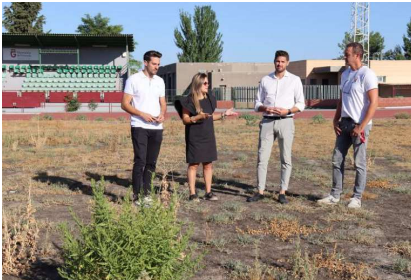
El vicepresidente tercero y diputado provincial de Deportes, en su visita a la Ciudad Deportiva.