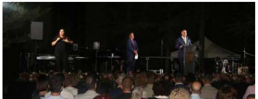
La actuación del cantaor Miguel Poveda cerró el homenaje.