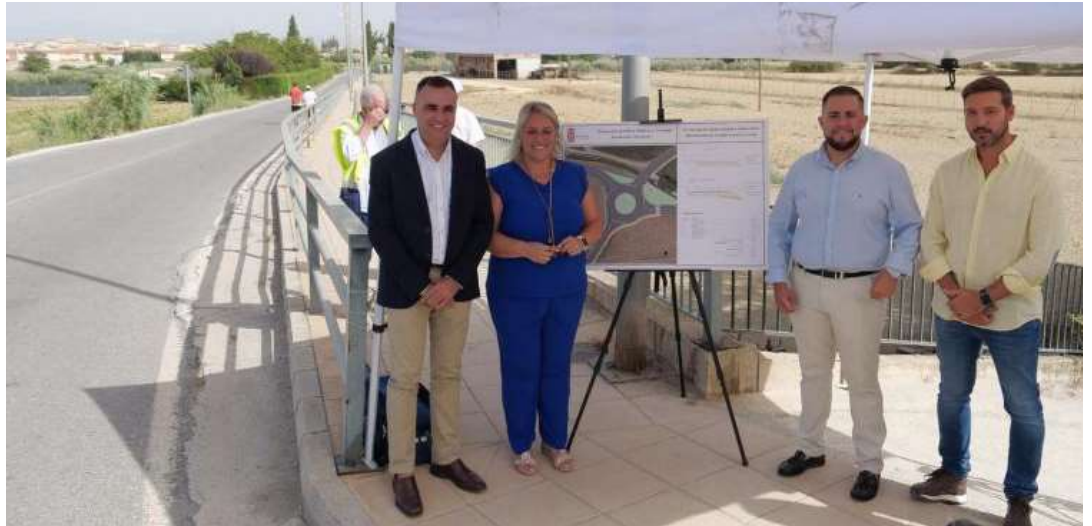
El presidente de la Diputación y la alcaldesa de las Gabias presentando el proyecto.

Rodríguez señaló que se trata de una carretera muy transitada que registra una media de 5 mil vehículos al día y que requiere del impulso y la inversión de la institución provincial para garantizar la seguridad,