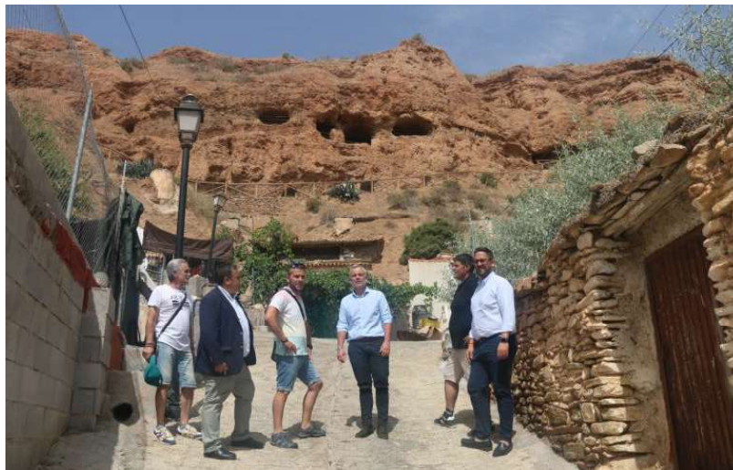
El Vicepresidente Primero y Diputado de Agua, Promoción Agraria y Medio Ambiente, en su visita a Beas de Guadix.