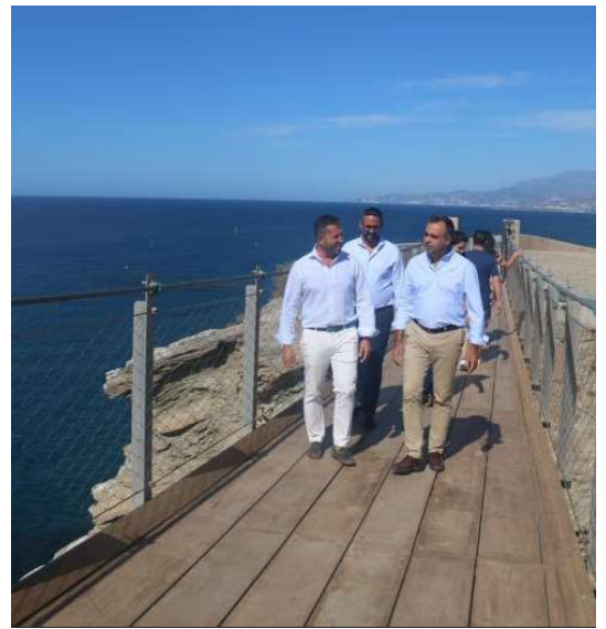
Puente colgante de Torrenueva Costa.