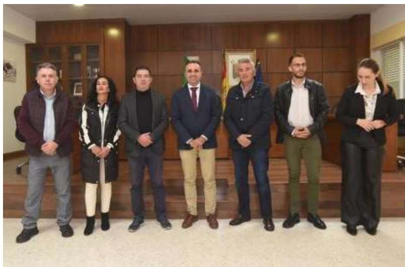
Visita institucional del presidente de la Diputación de Granada, Francis Rodríguez, al municipio de Escúzar.