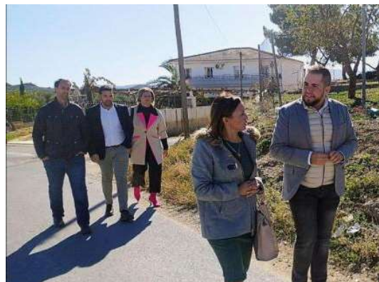
La Diputación de Granada consultó las necesidades de Cuevas del Campo.

En cuanto a Cuevas del Campo, el diputado presenció las obras realizadas por la Dipu-