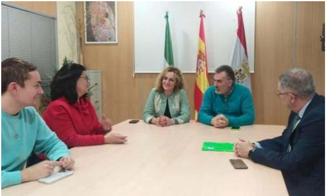
La vicepresidenta segunda y diputada de Turismo reunida junto al alcalde de Santa Fe.