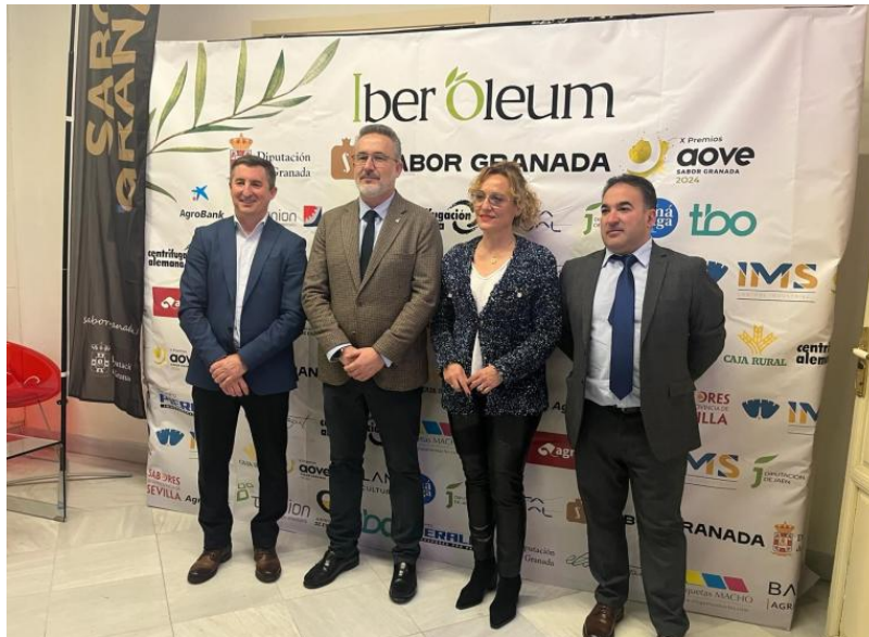
La actividad se enmarca en la X edición de los premios AOVE Sabor Granada.

Las catas se han desarrollado con tres AOVES selección de Granada de nueva cosecha, uno