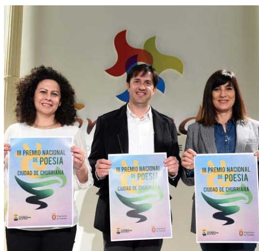
El galardón vuelve a contar con una dotación de 3.000 euros para el mejor libro de poesía publicado en 2023 y 1.500 euros para la editorial.

La Diputación de Granada confía en una gran participación activa de la comunidad atlética en este XXXVII Gran Premio de Fondo Diputación “Universo Lorca”, contribuyendo al fomento del deporte y la salud en la provincia.