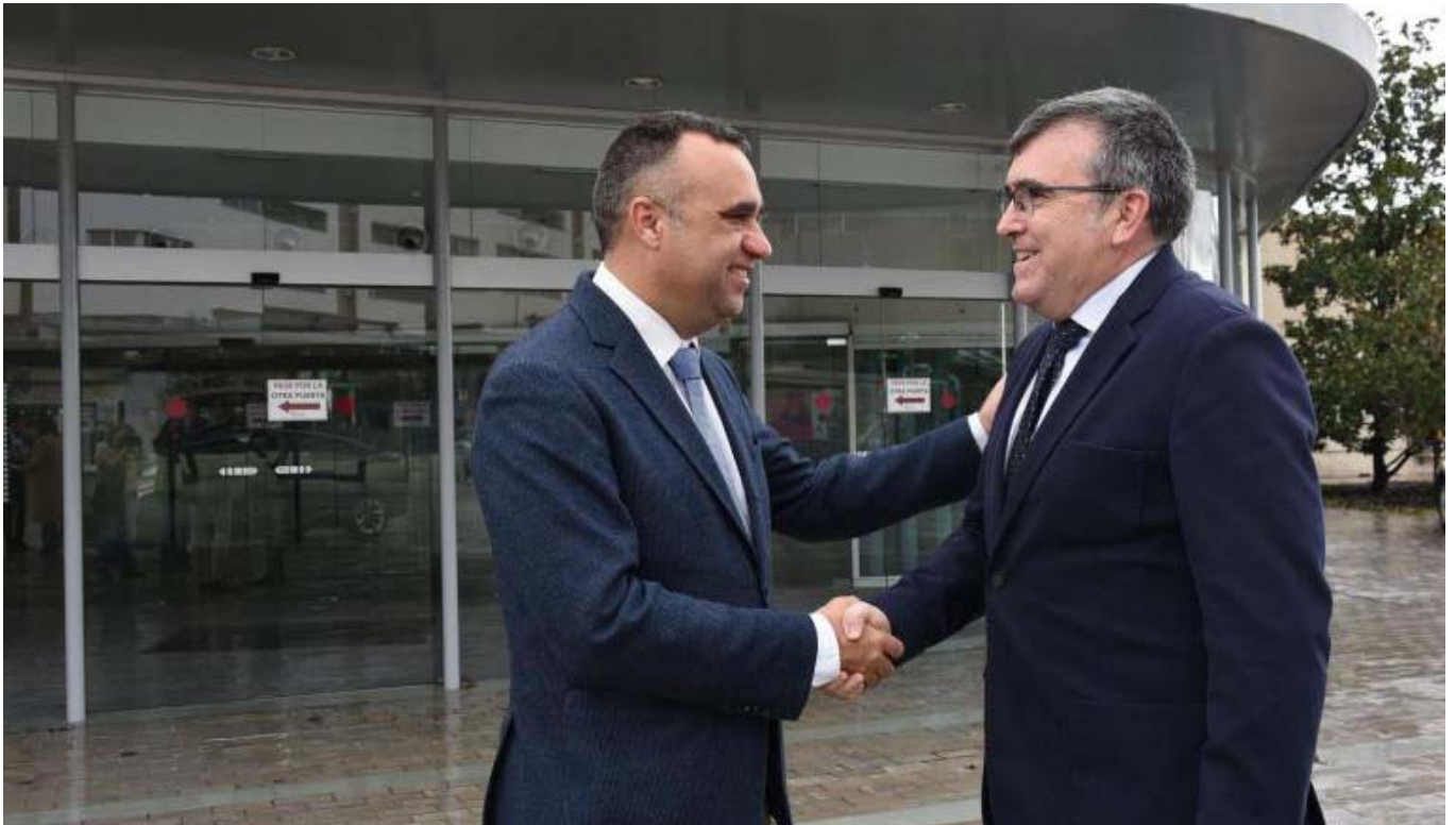
Montilla ha trasladado su disposición a colaborar en cuantos proyectos impulse la institución que puedan contar con el apoyo del Gobierno central. Ambos han repasado algunos asuntos, como el desarrollo del proyecto Digraqua, para la digitalización del ciclo urbano del agua, y los planes de Sostenibilidad Turística en Destino del Geoparque y de Los Montes, Loja y Alhama de Granada.