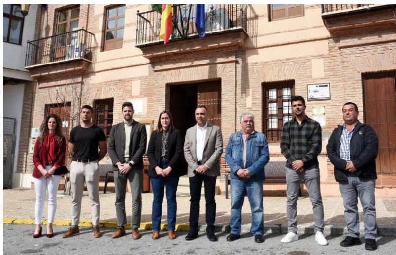
Visita del presidente de la Diputación y el diputado de Deportes al municipio de Cádiar.