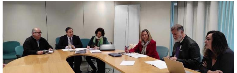
Celebración de la junta arbitral de consumo.

Los PIC, dirigidos por técnicos especializados en derecho del consumo, han desempeñado un papel crucial al ofrecer servicios de información, asesoramiento, gestión de consultas, quejas, reclamaciones y solicitudes de arbitraje. Además, han facilitado la mediación entre consumidores y empresas, gestionando casos que requieren la intervención de las autoridades competentes.