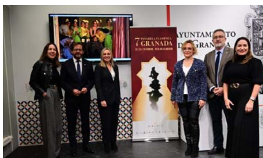
Diputación colabora con el Ayuntamiento en la pasarela Flamenca Granada.

El “Túnel de los AOVE” es una exposición pública de todos los envases de los aceites presentados en la X edición de los Premios AOVE Sabor Granada y en la Guía IberOleum, que está instalada junto a la Oficina de Turismo, en el Palacio Colegio de Niñas Nobles.