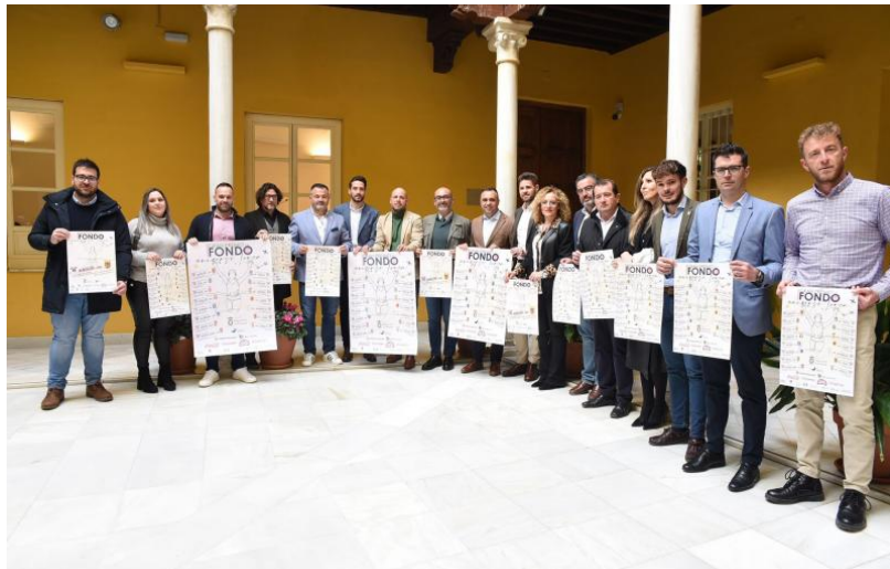
El Gran Premio de Fondo ‘Universo Lorca’ de Diputación arranca en Albolote.

del impacto positivo del deporte e invitamos a todos los participantes a disfrutar de esta experiencia única que enriquece tanto a nivel personal como colectivo. Desde la Institución Provincial, esperamos que este Gran Premio sea una celebración de la pasión por el deporte y un recordatorio de la importancia de la fortaleza de nues-