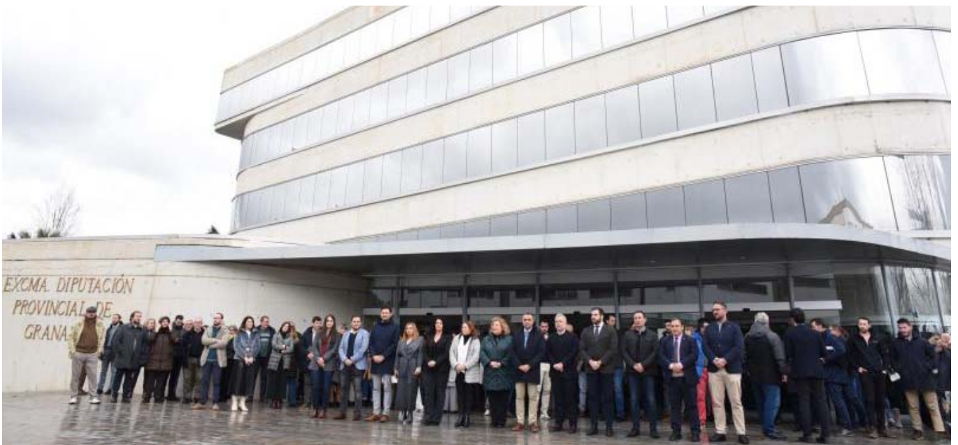
A la convocatoria del minuto de silencio acudieron representantes de todos los partidos políticos que componen la Corporación Provincial, así como trabajadores de la institución.