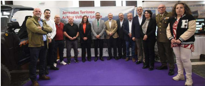
Tercera edición de las Jornadas de Turismo Activo del Valle de Lecrín.

Crecimiento. El evento, que ha alcanzado este año su tercera edición, tiene como objetivo estrechar lazos entre empresas y administraciones para impulsar la comarca