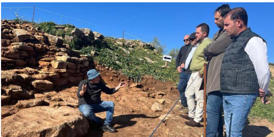
Visita institucional del diputado de Obras Públicas y Vivienda, José Ramón Jiménez, al yacimiento ubicado en Villavieja.

Como novedad en este año, con las mismas condiciones expuestas en el párrafo anterior, también podrán ser beneficiarios los Municipios con población entre 20.000 y 50.000 habitantes que hayan experimentado tasa de crecimiento demográfico negativo (pérdida poblacional) en el periodo de los últimos 10 años, para que sea representativo de la masa poblacional residente en un municipio y no distorsione los resultados por movimientos migratorios puntuales.