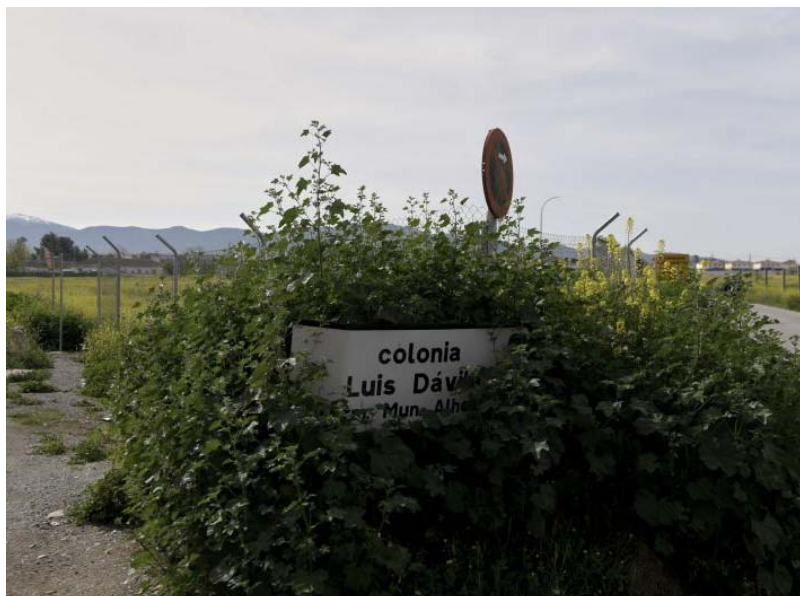
Terrenos pertenecientes a la colonia Luis Dávila que pretende usar la Diputación para el proyecto.