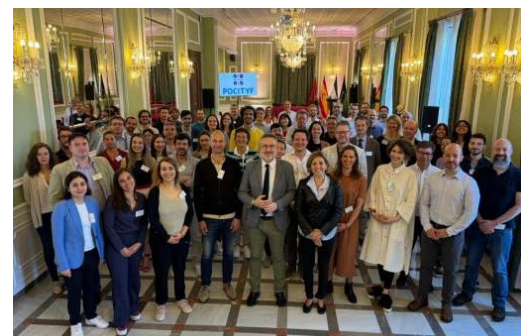
POCITIF ha reunido a socios europeos de 13 países en Granada.

En el proyecto han participado varias ciudades patrimoniales europeas, como son Évora (Portugal) Alkmaar (Países Bajos), Granada (España), Bari (Italia), Celje (Eslovenia), Ujpest (barrio de Budapest en Hungría), Ioannina (Grecia) y Hvidovre (Dinamarca).