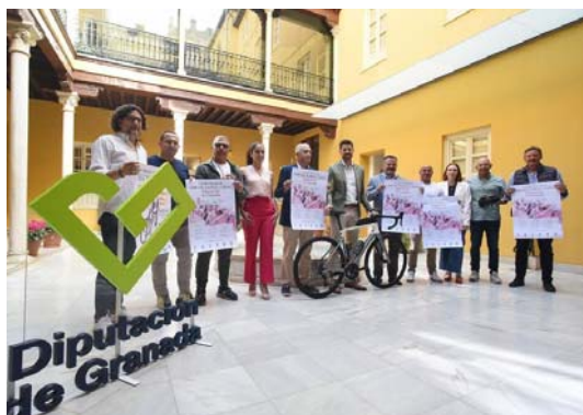
Escobedo presenta el Circuito de Ciclismo de Carretera Escuelas y Cadetes.

Recibirán un premio a la participación todos aquellos que hayan concursado en las tres carreras que conforman el circuito, así como los tres clubes con mayor número de participantes en dichas pruebas.