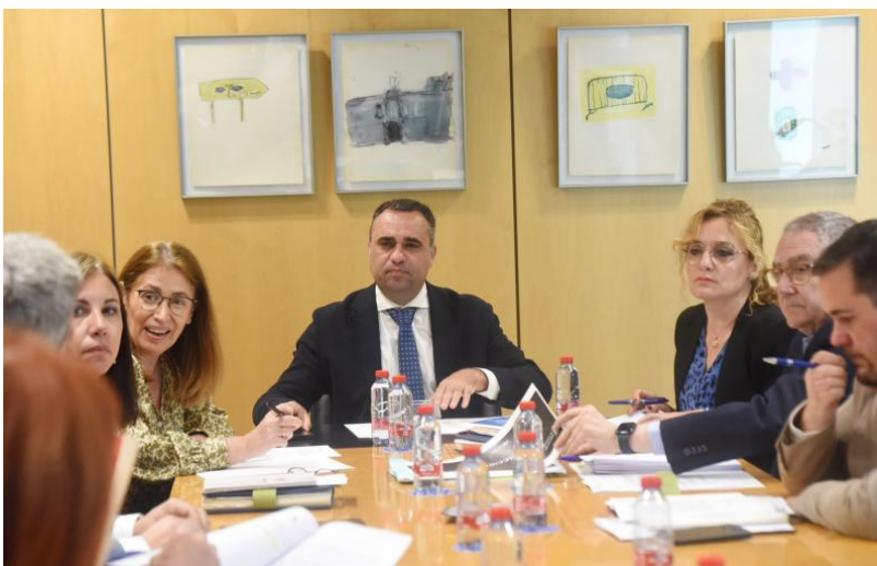
En la reunión se ha tratado, entre otros asuntos, aprobar la Memoria de Actividades del año 2023, la propuesta de aprobación del Plan de Actividades del año 2024 y la rectificación del inventario de bienes muebles del ejercicio 2023.