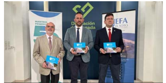
Diputación participa en los actos de clausura del aniversario de la EFA El Soto.