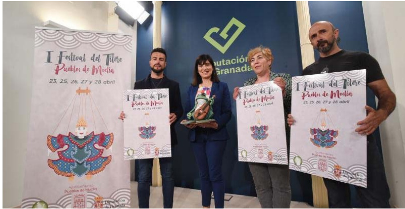
Presentación de la primera edición del Festival del Títere Pueblos de Moclín.