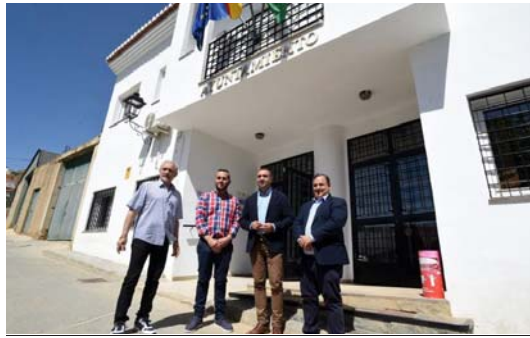
Visita al municipio granadino de Beas de Guadix.