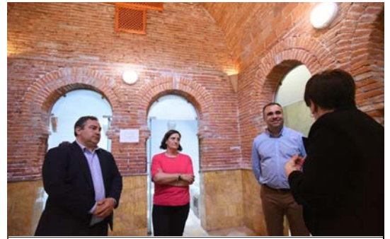
Rodríguez también estuvo presente en Cortes y Graena.