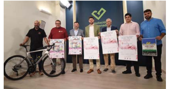
El diputado Eric Escobedo, en la presentación del Circuito.