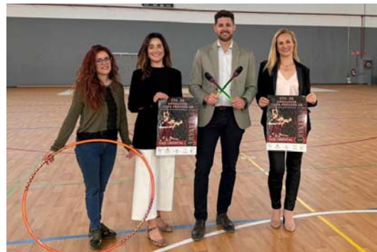
Presentación del Sector Oriental de Gimnasia Rítmica de la Precopa y Copa de Andalucía.