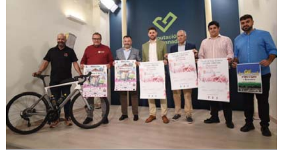
El diputado Eric Escobedo, en la presentación del Circuito.