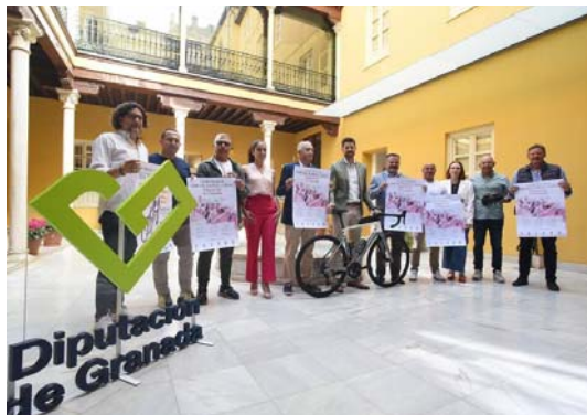
Escobedo presenta el Circuito de Ciclismo de Carretera Escuelas y Cadetes.

Recibirán un premio a la participación todos aquellos que hayan concursado en las tres carreras que conforman el circuito, así como los tres clubes con mayor número de participantes en dichas pruebas.