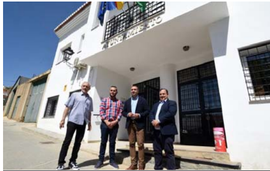
Visita al municipio granadino de Beas de Guadix.