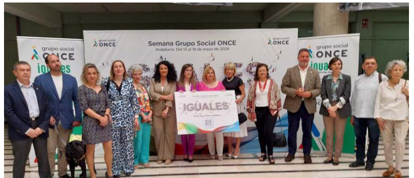
La diputada de Bienestar Social, Igualdad y Familia, Elena Duque, durante el acto de inauguración.

Por último, en el marco de l programa de atención a Familias en situación de urgente necesidad, en 2023 se han atendido a un total de 2.507 familias con una inversión de 3.148.064 euros.