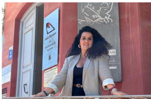
La diputada de Bienestar Social, Igualdad y Familia, Elena Duque.

Además, ha añadido que "los talleres desarrollados han sido más que simples actividades recreativas, ya que han servido como espacios de encuentro, aprendizaje y crecimiento personal para todos los participantes. Quiero expresar mi más sincero agradecimiento a todos los usuarios, familias, colaboradores y al equipo del Centro Psicopedagógico Reina Sofía por su dedicación y compromiso en la organización de este evento. Sigamos trabajando juntos para construir una sociedad más inclusiva".