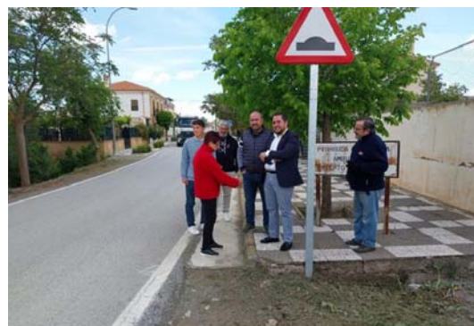
El diputado de Obras Públicas y Vivienda, José Ramón Jiménez, en Ventas de Huelma.

Jiménez ha destacado que “la mejora de este camino es una prioridad para nuestro gobierno en el ámbito de las obras públicas y vivienda. Este trayecto es vital para la conectividad y el desarrollo de estos municipios, facilitando el acceso a servicios básicos y promoviendo el crecimiento económico local”.