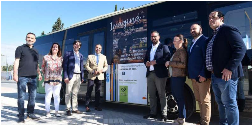
Presentación de la campaña 'Imagina' con motivo del Día Internacional del Reciclaje.