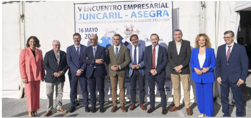
El presidente de la Diputación de Granada, Francis Rodríguez, en la quinta edición del evento.